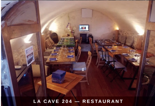
LA CAVE 204 — RESTAURANT

Privatisation pour groupe de séjour détente et ressourcement Trois services, un lieu