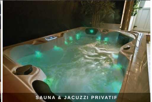
SAUNA & JACUZZI PRIVATIF